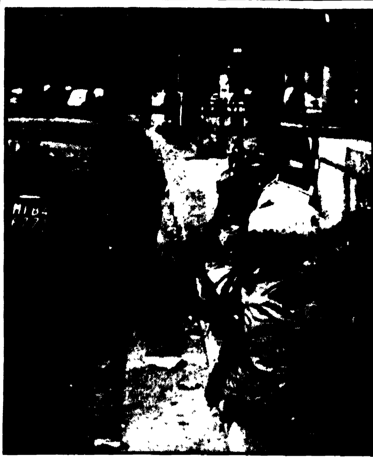
Si pulisce a Milano Da oggi verranno raccolti i rifiuti che nei giorni scorsi sono stati lasciati nelle strade di Milano, per lo sciopero dei netturbini. In alto: un'azione di protesta dei lavoratori della siderurgia, con il loro sciopero di solidarietà

«L'inflazione», ha detto, «è un fenomeno relativo, che dipende dal modo di considerare i prezzi». Il professore ha poi parlato della situazione attuale, in cui i prezzi di alcuni prodotti farmaceutici e dei concimi chimici stanno diminuendo, mentre i prezzi delle automobili stanno aumentando.