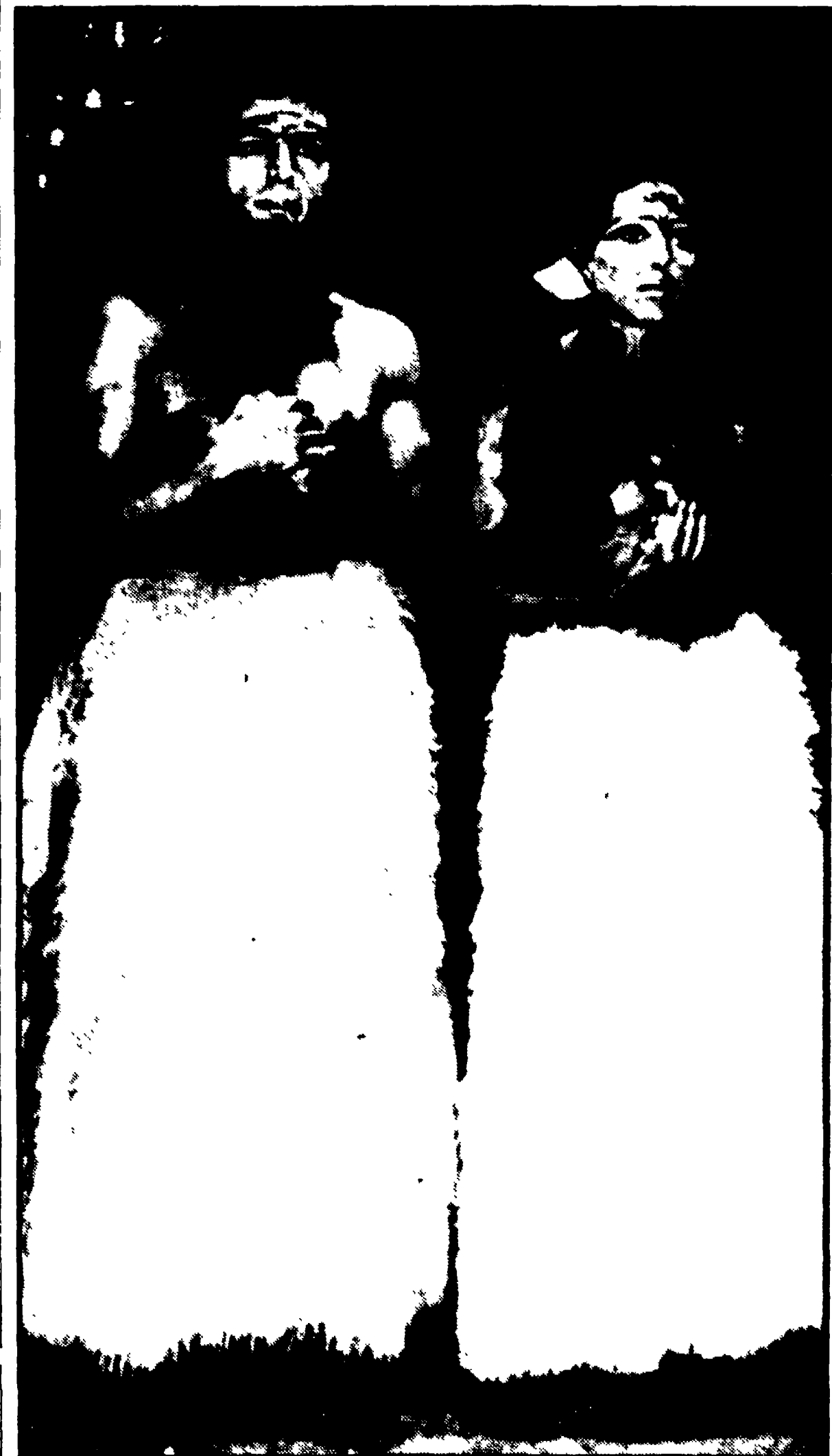
Che il nude-look, la moda di vestirsi spogliandosi, sia un gusto antico lo sanno ormai tutti. Si può dire che la cosa sia cominciata addirittura con Adamo.