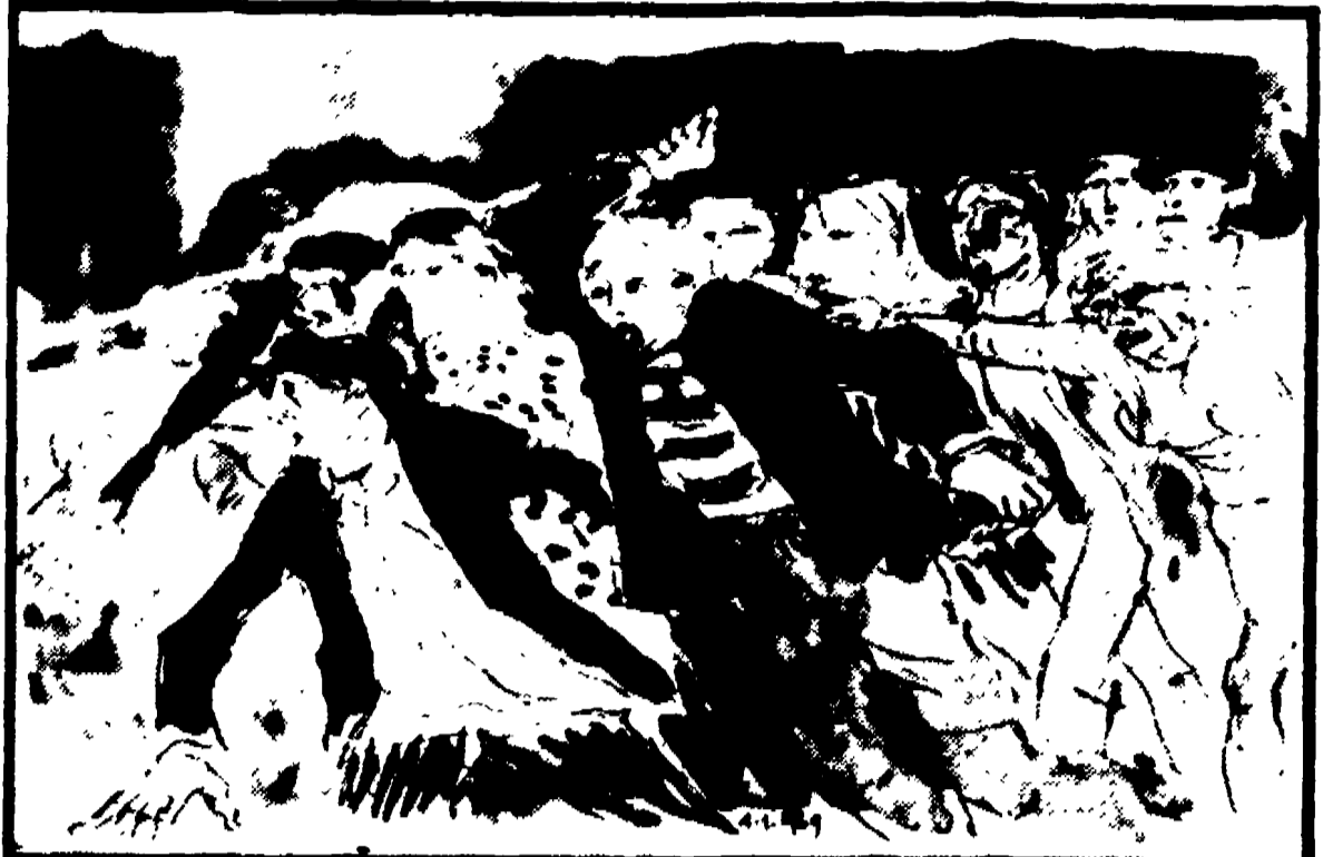
Gabriele Mucchi: studio per «I giovani insorgono», 1969