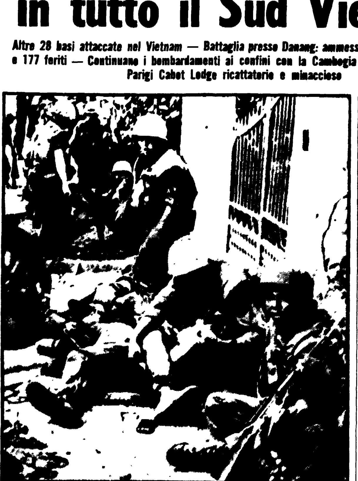
SAIGON — L'attuale offensiva delle forze di liberazione ha inflitto pesanti perdite all'aggressore. Nei primi tre giorni di questa settimana, secondo le cifre fornite dal comando americano, sono morti quasi duecento soldati USA, circa il doppio di quanti ne erano rimasti uccisi nell'intera settimana precedente. Nella foto: i soldati americani feriti dopo un combattimento nella zona di Hue (avvenuto prima dell'offensiva in corso del PNL).

Altro 28 basi attaccate nel Vietnam — Battaglia presso Daang: ammessi dagli yankee 20 morti e 177 feriti — Continuano i bombardamenti ai confini con la Cambogia — Alla conferenza di Parigi Cabot Lodge ricattatorio e minaccioso