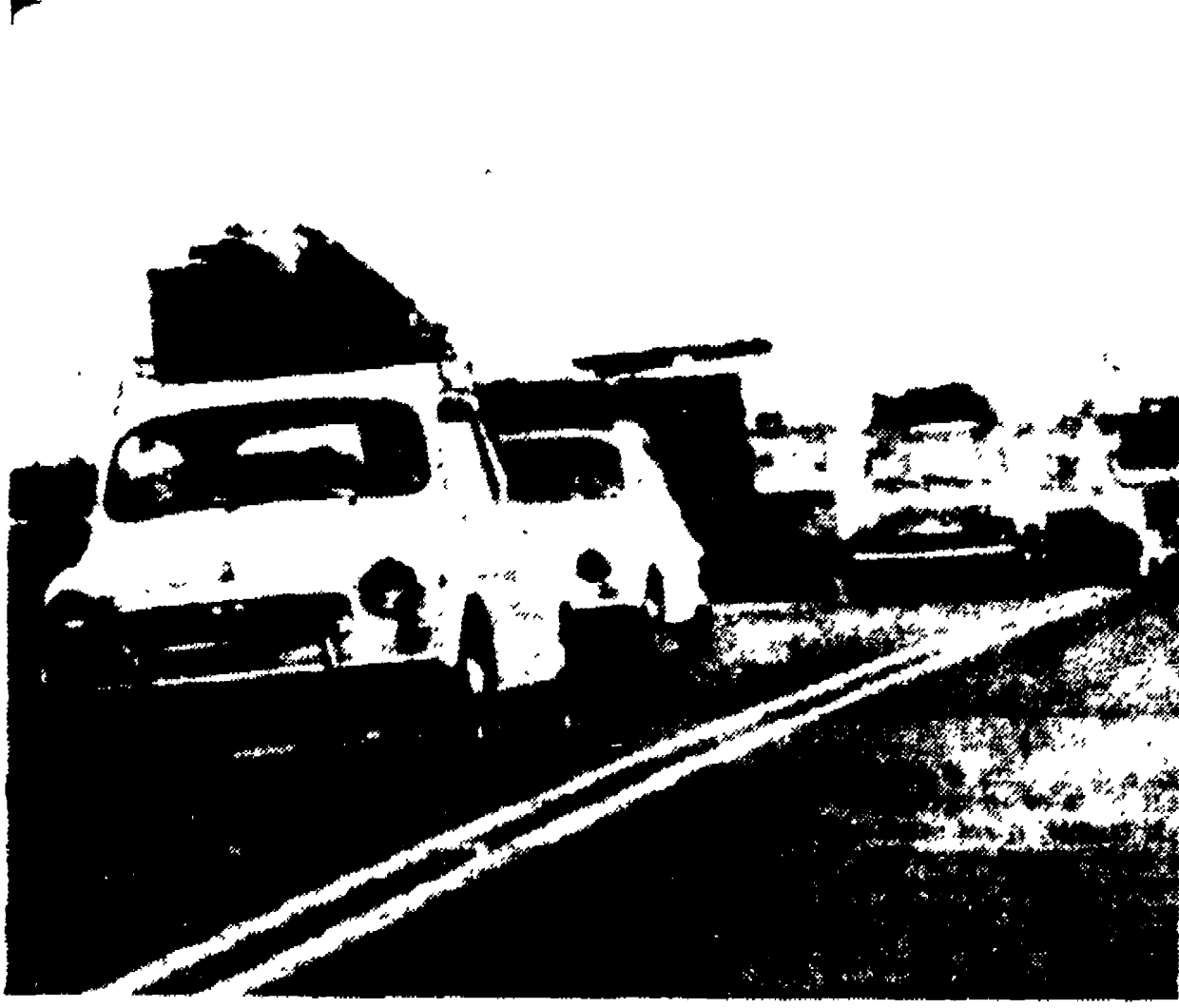
Una fila di automobili, bagagli sui tetti, fotografata lungo la via Aurelia verso le 18 di ieri sera. Più tardi e nella notte il traffico si è fatto più intenso.

Inferiore al previsto il numero dei gitanti tornati a casa - Preferiti i Castelli e i laghi - Amare sorprese per le visite dei «soliti ignoti» - Spiagge affollate malgrado il mare mosso e un acquazzone