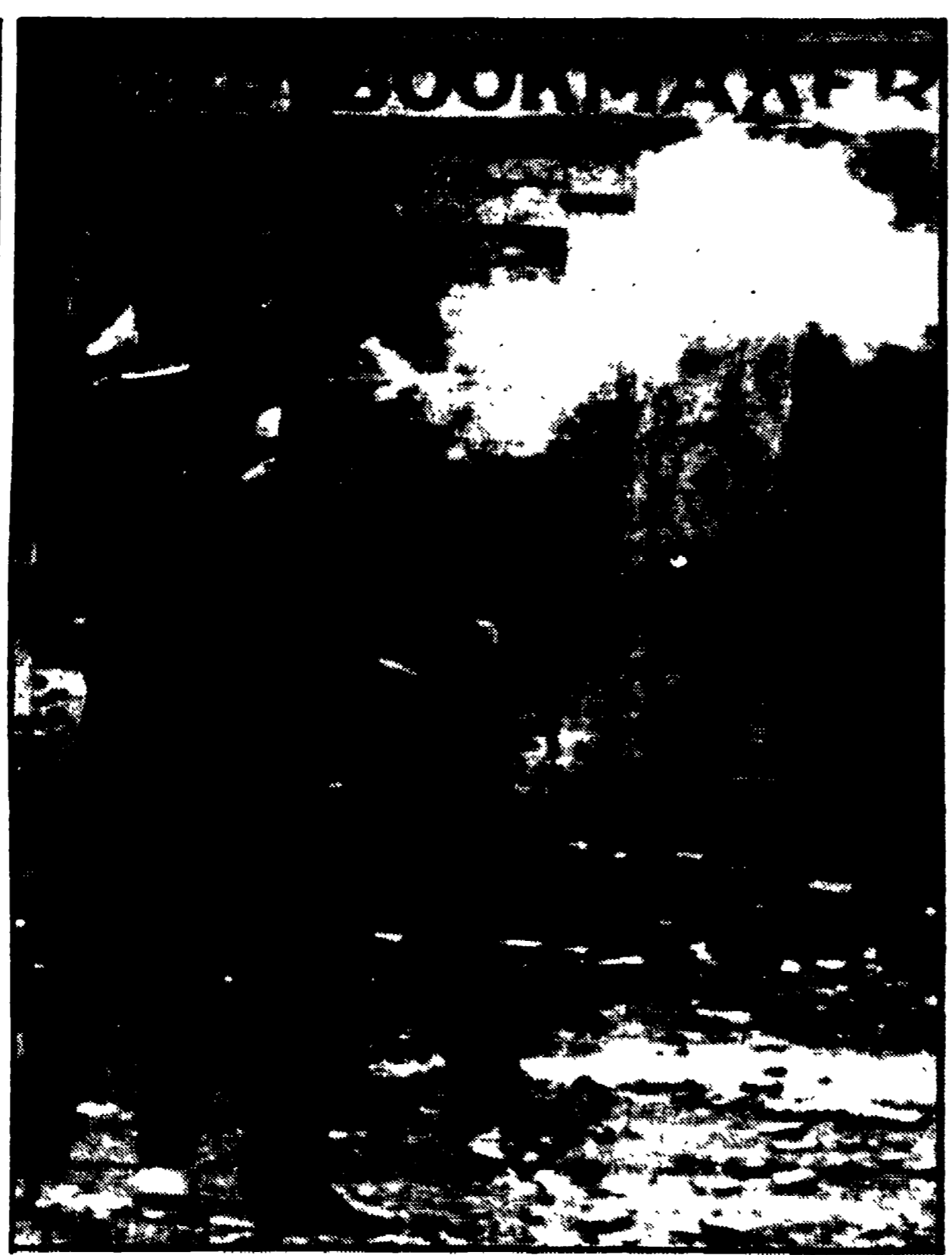
LONDONDERRY — Poliziotti lanciano gas contro i dimostranti cattolici