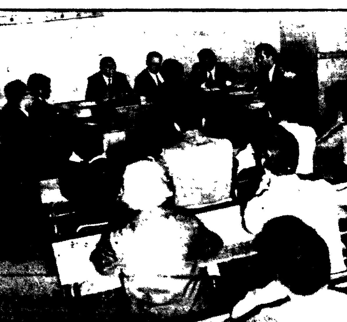
Un momento delle prove orali al liceo scientifico « Plinio Seniore » di Roma