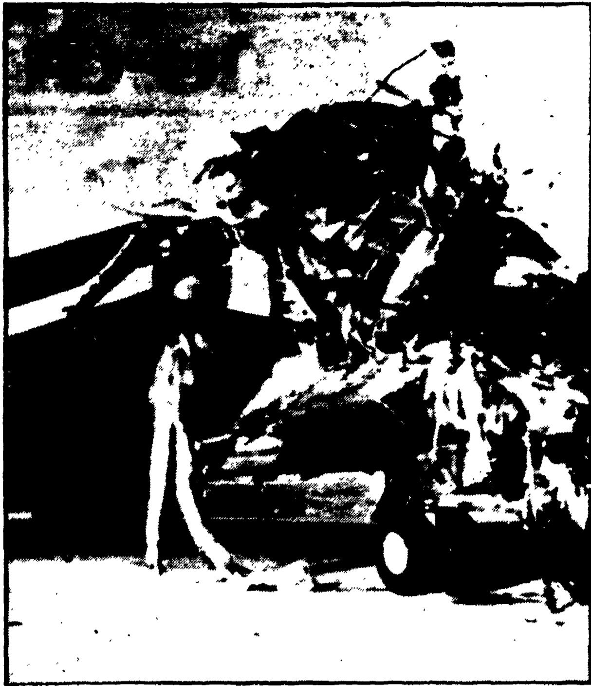
DAMASCO - I danni prodotti al Boeing dallo scoppio della bomba nella cabina di pilotaggio: sono chiaramente visibili in questa foto. Ci vorranno 4 mesi per ripararli.

di ha imposto il dirottamento dell'aereo verso il Libano. Poco dopo, con incredibile sangue freddo, la ragazza ha trasmesso per radio due messaggi, uno rivolto a tutti gli aeroporti, l'altro ai passeggeri. Il primo diceva: «Il Fronte popolare per la liberazione della Palestina (FPLP) ha l'onore d'informarvi che l'Unità di comando "Che Guevara" ha ora il completo controllo del Boeing 707 del volo 840 della TWA diretto all'aeroporto di Lydda, nel territorio occupato della Palestina. Il capitano Scidayah Abu Ghazaleh (il cui vero nome è Leila A. Khalid), e l'agente Salim K. Essawi, entrambi muniti di passaporti diplomatici irakeni, si sono imbarcati a Fiumicino. Quando l'aereo è giunto nel cielo di Brindisi, il piano è scattato. L'uomo ha puntato un'arma automatica contro i passeggeri e li ha costretti a restare fermi nelle loro poltrone; la ragazza è entrata nella cabina di guida ed ha pilotato contro il comandante Dean Carter e contro il secondo pilota e l'ufficiale di rotta un piccolo fucile mitragliatore, che era riuscito a recare con sé a bordo tenendolo nascosto sotto il soprabito: quin-