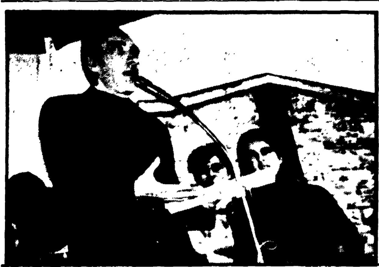
FIRENZE - Don Mazzi parla ai fedeli della comunità dell'Isolotto mentre il cardinale Florit celebra la messa nella chiesa