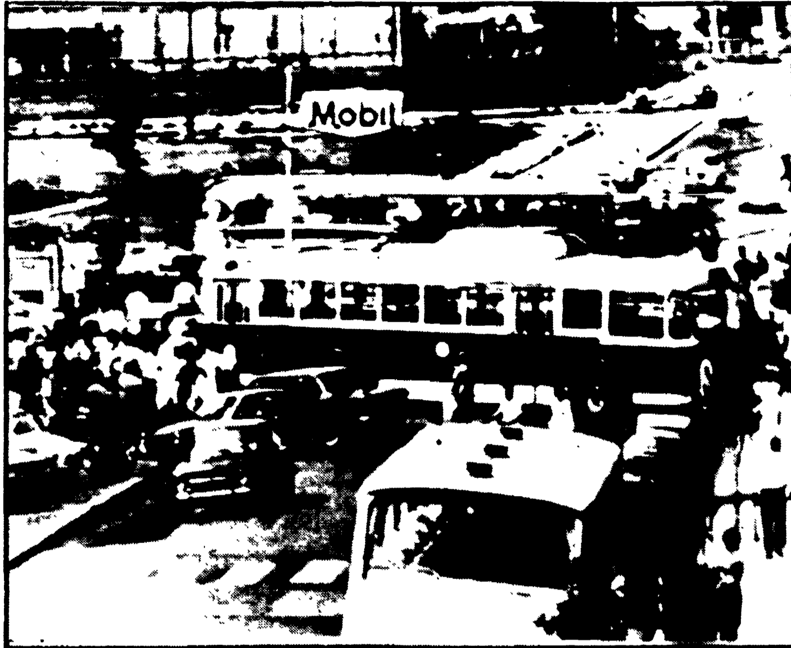
Un momento della protesta di ieri nelle strade di Caserta