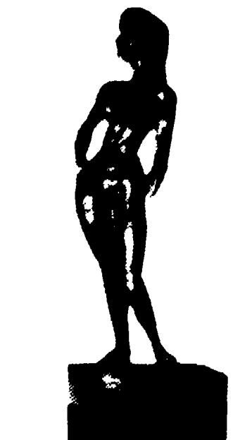
«Nudo di donna»