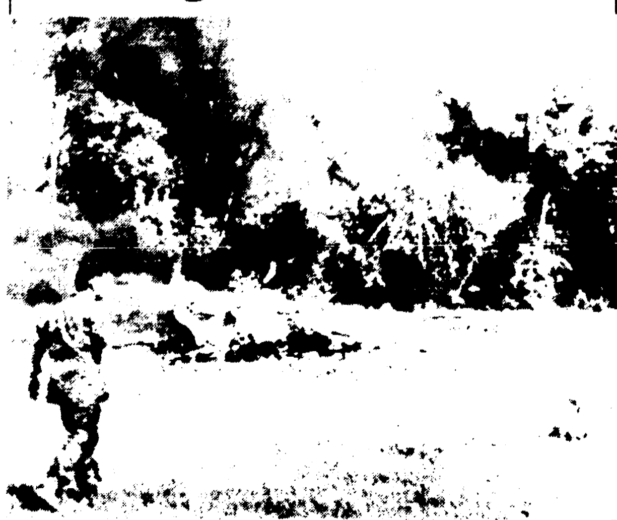
La rinnovata aggressione americana nel Laos è stata denunciata ieri da oltre tremantimila fiotti: il sen. Mansfield e il «New York Times». Intanto i B-52 hanno continuato i bombardamenti a tappeto sul Sud Vietnam.

Un discorso a Stoccarda del «leader» socialdemocratico