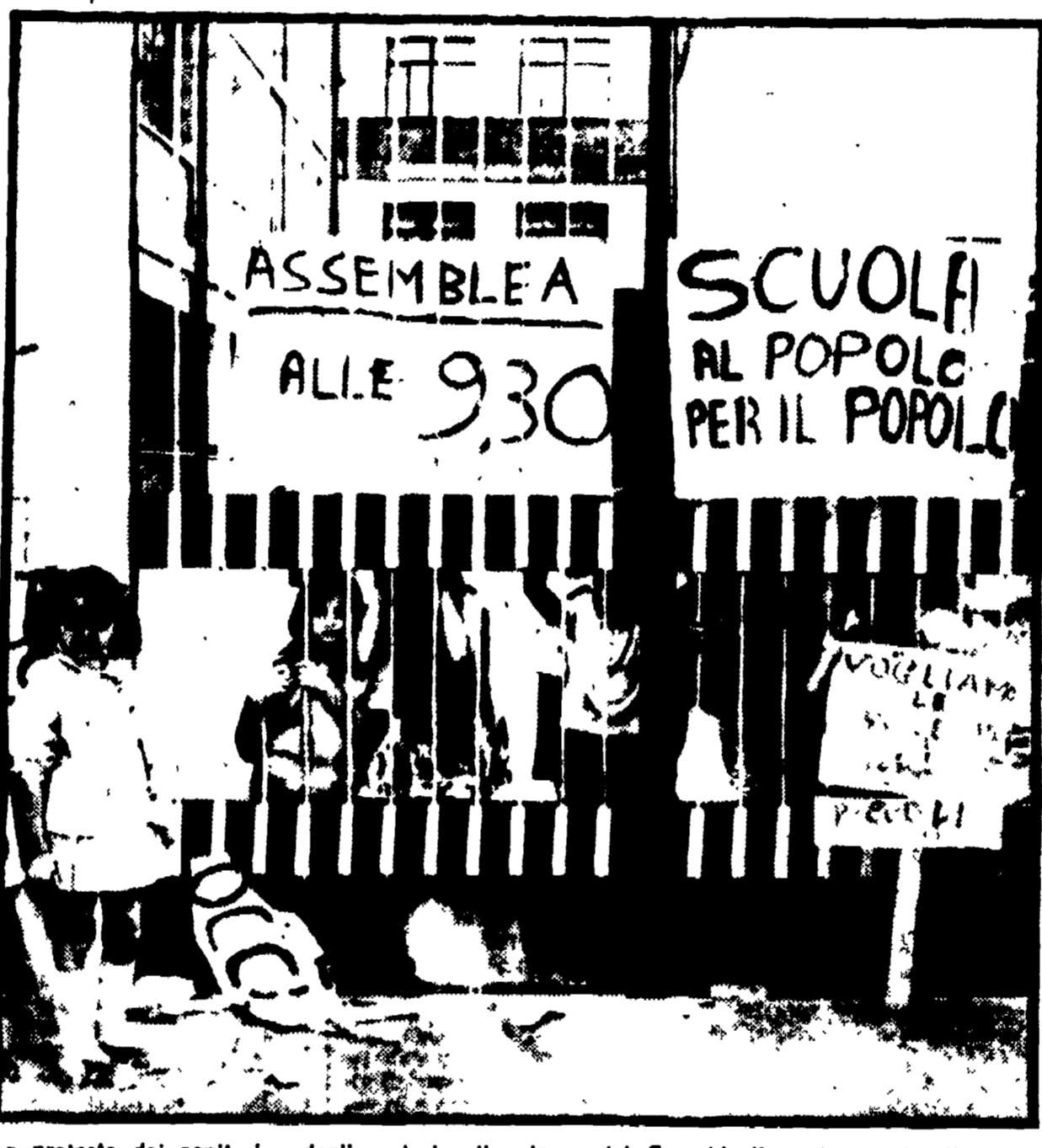
La protesta dei genitori e degli scolari sulla piazza del Campidoglio e la scuola di Pratorotondo occupata da cinque giorni.