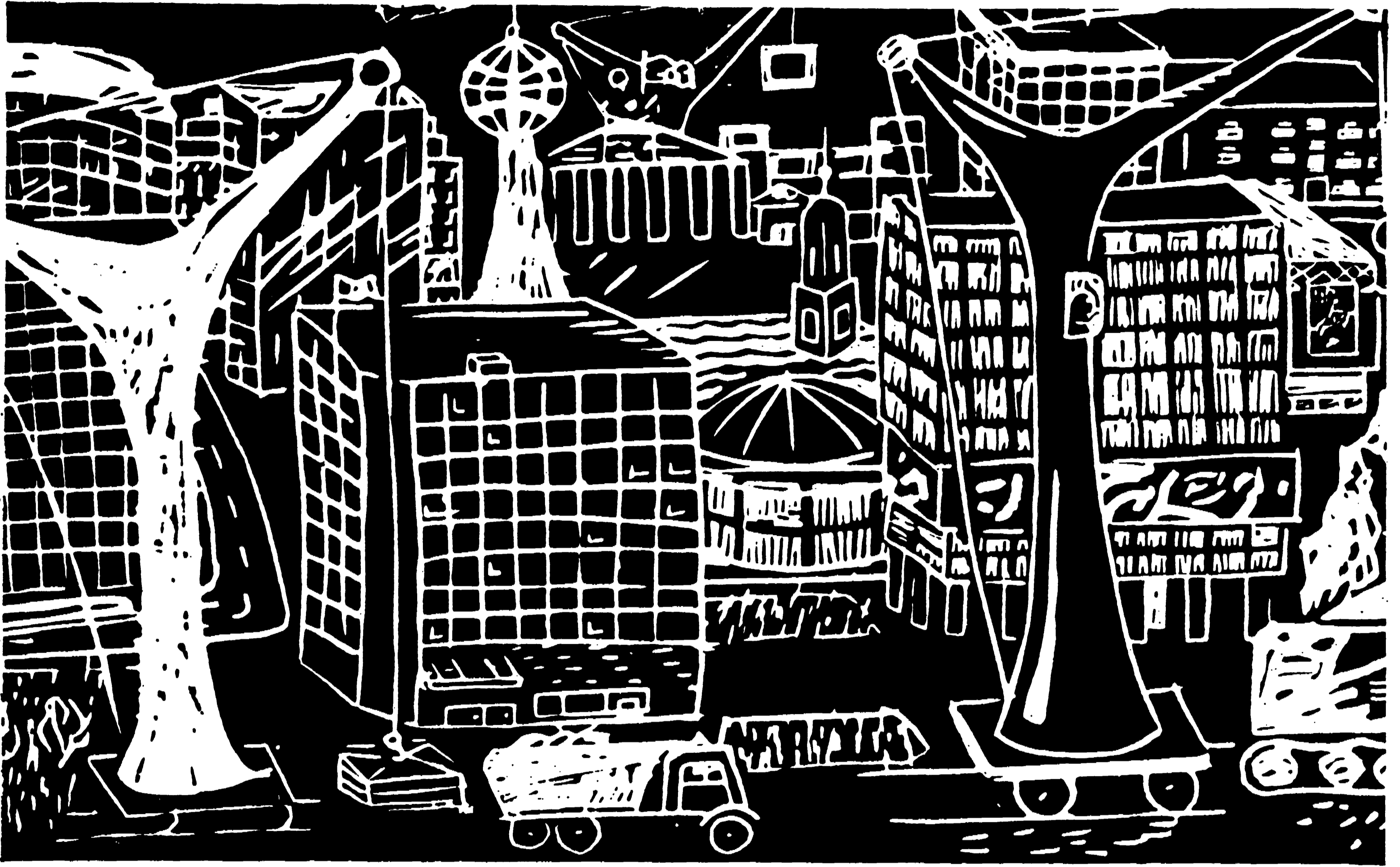
(Stampa su linoleum di Heidi Barth, 9 anni, Berlino)

Questa è la gru, con la quale mio padre monta le nuove case nella nostra città.