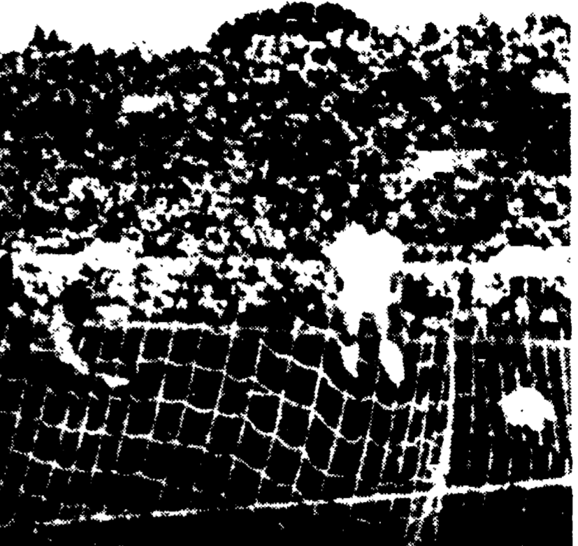
LAZIO-FIORENTINA - Il risultato più clamoroso della sesta giornata del campionato di calcio è senza dubbio quello che è stato registrato all'Olimpico dove la Lazio ha sorprendentemente sconfiggato i campioni d'Italia col clamoroso e severo punteggio di 5-1.