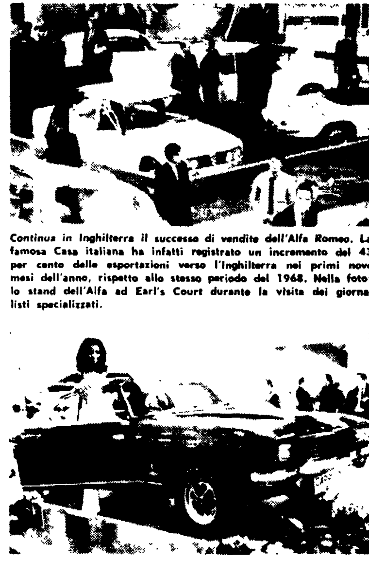
Continuando in Inghilterra il successo di vendite dell'Alfa Romeo. La famosa Casa Italiana ha infatti registrato un incremento del 43 per cento delle esportazioni verso l'Inghilterra nei primi nove mesi dell'anno...