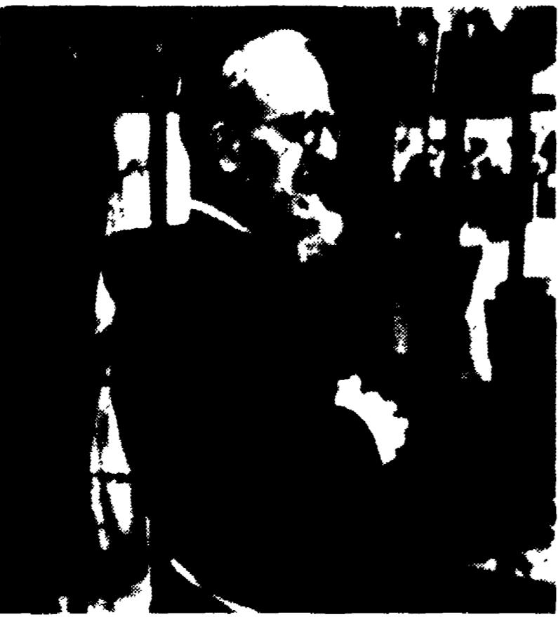
PRATO — Una immagine di padre Leonardo (al secolo Gioacchino Pelagatti) fondatore e direttore del famigerato Istituto dei Celestini. Morto nei giorni scorsi, padre Leonardo (la cui salma è stata trafugata e ritrovata nel giro di poche ore) è ora divenuto, da agente, strumento di un losco gioco speculativo che ha per posta la lottizzazione di venti ettari di terreno nel cuore della zona più bella di Prato.