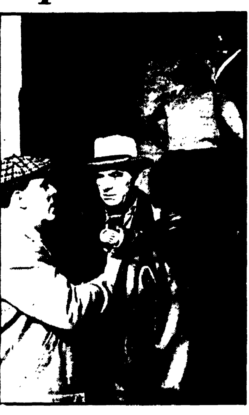
Dal nostro inviato

PARTINICO, novembre. Sono le due del pomeriggio. Poca gente sul corso, gli altri in casa a mandar giù in fretta un boccone prima di tornare al lavoro. Dalla corriera che arriva da Palermo scende uno sconosciuto, dimessamente vestito. Dall'angolo d'una casa sbucca un uomo, coppia in testa e lupara in pugno. Due raffiche di pallottoni e lo straniero crolla a terra in un lago di sangue, stecchito. Fuggi fuggi generale, quattro vecchiette si segnano.