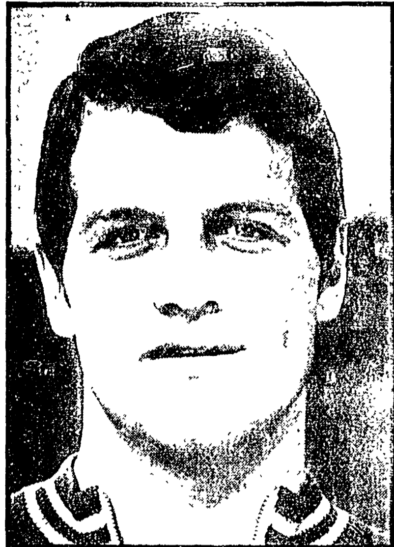
CAPELLO rientra nella Roma, è una garanzia che la squadra ritroverà il gioco e l'ispirazione.

I neroazzurri giocano in casa contro la Lazio. Difficili trasferte per Cagliari, Fiorentina e Milan privi di Riva, Chiarugi e Rivera.