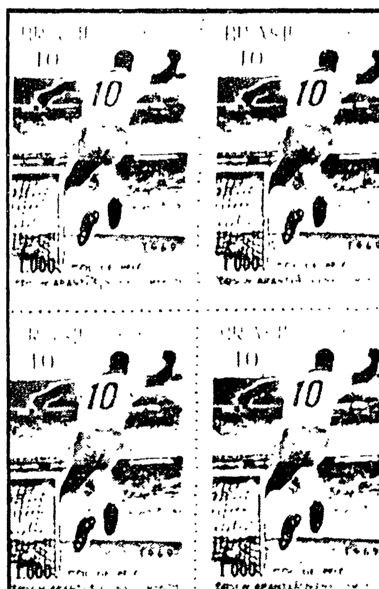
Il campionato di serie C. Il campionato di serie C. Il campionato di serie C.

L'Atalanta dovrebbe addirittura vincere a Cesena per tentare una improbabile egemonia, mentre per il Genoa la situazione si fa sempre più grave, e forse anche qui per una sua rete indecisa, sono da parte dei dirigenti. E fra i favoriti per il Genoa, il Piacenza che sta facendo, meno attendibile.