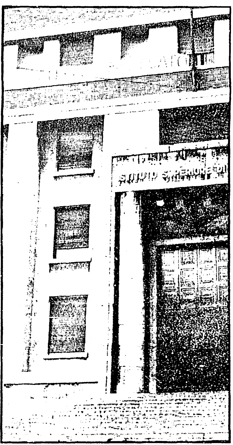
Da molti giorni ormai l'Istituto di Sanità è bloccato.

Il primo giorno di sciopero nazionale dei dipendenti degli enti locali ha registrato in città altissime percentuali di assenteismo: gli oltre 22 mila lavoratori capitolini, che proseguiranno la lotta oggi e domani, sono impegnati per una settimana del massimo delle quali che funzionali, e per una rapida moderna ed efficiente ristrutturazione degli uffici, con decentramento amministrativo. La prima giornata di astensione dal lavoro ha visto unita e compatta la categoria degli impiegati che hanno prestato servizio, nessun netturbino ha raccolto i rifiuti (tanto che in città sono riapparsi subito enormi mucchi di immondizia lungo le strade; chiuse le imposte di consumo, gli uffici dell'anagrafe e quelli del Campidoglio come della Provincia.