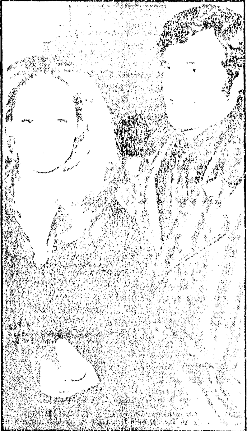
PARIGI. Jean Paul Gaultier, accompagnato dall'irresistibile Ursula Andress...