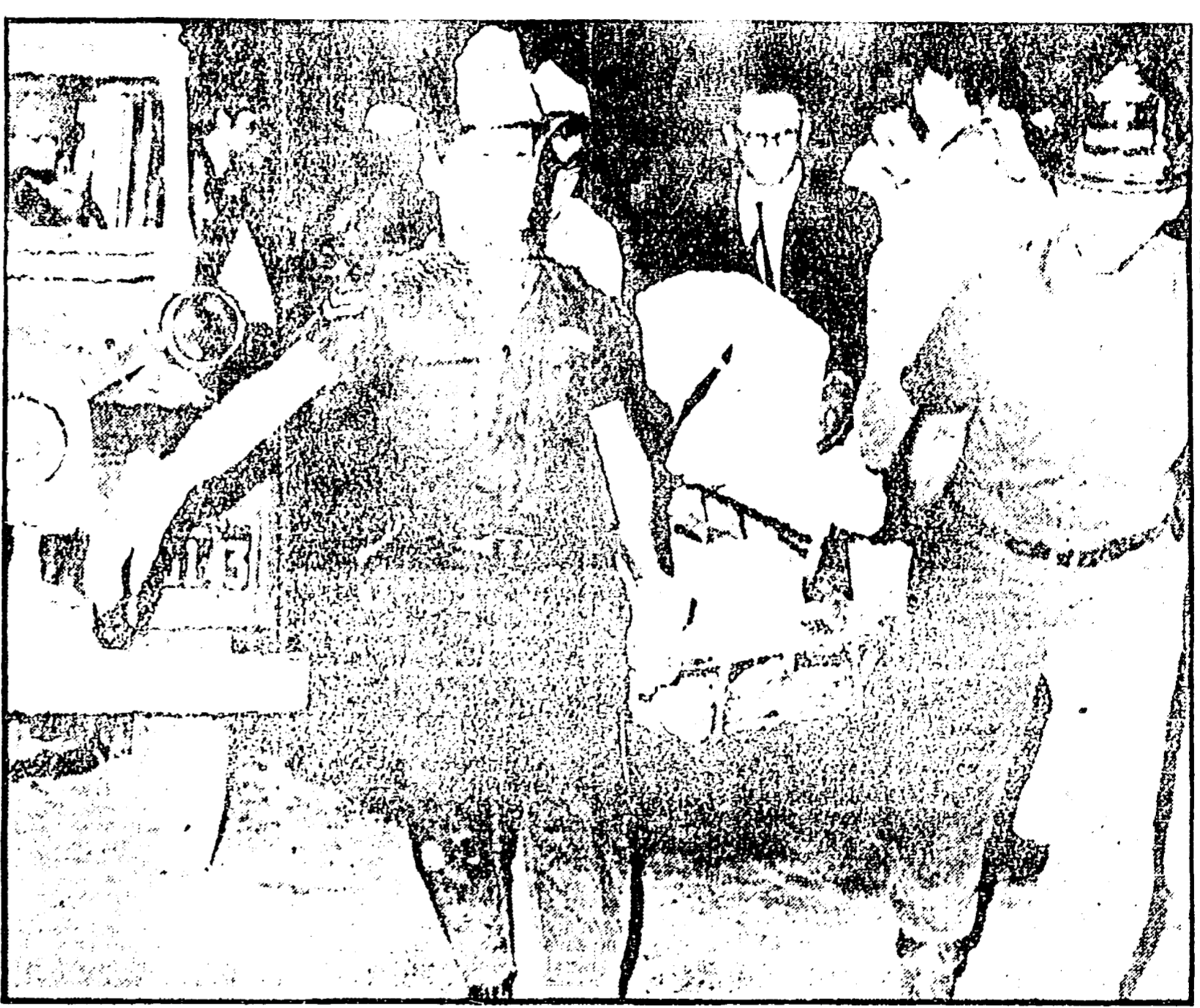
Le squadre di soccorso si sono presentate sul luogo dell'incidente. Nella foto: le squadre di soccorso al lavoro.

Un quadriglietto « Boeing » dell' Air France è precipitato nel mare dei Caraibi, al largo della costa venezuelana, poco dopo il decollo dall'aeroporto internazionale di Maiquetia. A bordo c'erano 62 persone, fra cui un neonato, i componenti l'equipaggio (per un totale di 11 persone) e un intero equipaggio di rotazione.