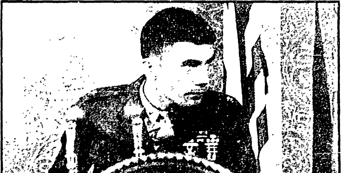
LAS VEGAS — Il genero di Johnson, maggiore dei marines Charles Robb, fotografato durante la conferenza stampa che ha tenuto per rispondere alla accusa di aver massacrato civili sudvietnamiti. L'ufficiale si è dichiarato innocente, ma ha ammesso che alcuni crimini potrebbero essere stati commessi da uomini ai suoi ordini, naturalmente a sua insaputa.

Soldati comandati da Robb avrebbero partecipato al massacro di Song My