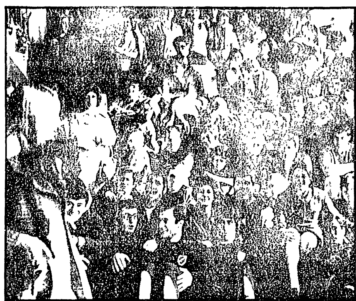
Un centinaio di studenti dell'ISEF (Istituto Superiore di Educazione Fisica), in agitazione già da qualche giorno, hanno occupato simbolicamente (nella foto) ieri mattina il palazzo delle Federazioni sportive del CONI, in viale Tiziano. I giovani hanno voluto effettuare una azione dimostrativa per il mancato riconoscimento di alcune loro richieste. Fra l'altro i futuri professori di educazione fisica lamentano il fatto che il loro diploma non abbia valore di laurea. L'occupazione ha avuto termine quando il CONI ha assicurato il suo intervento favorevole presso il ministero. Nella foto: la protesta degli studenti dell'ISEF.

Senza voli fino a lunedì. Lo sciopero iniziato ieri alle 12.30 che terminò alle 24 di notte, è stato proclamato unitamente dal sindacato ANAR (Cgil, Filcams, Cisl, Uil) e dall'Alitalia, la notte scorsa al momento di lasciare l'aeroporto di Fiumicino, e nel quadro delle lotte per il rinnovo del contratto nazionale dei lavoratori dell'aerea a partecipazione statale, impegnati sul jet 778 partito da Fiumicino verso le 21 di giovedì, giunti all'aeroporto di Teheran, hanno chiesto allo scapolo di 4 ore che si susseguivano per la notte, e che era stato proclamato dal sindacato nazionale per il rinnovo del contratto nazionale. Quattro steward e tre hostess sono stati respinti — nel loro punto di partenza — dal servizio di terra. A questo punto, il comandante ha deciso di far ripartire l'aereo malgrado lo sciopero e utilizzando due impiegati di terra non sindacati.