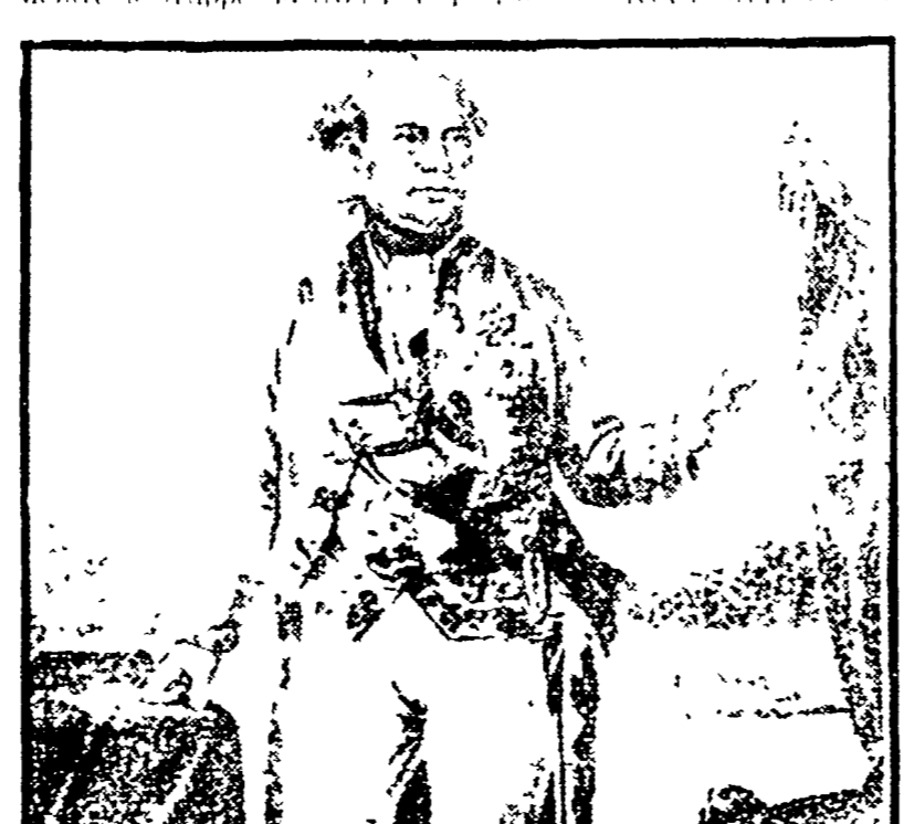
Leopoldo I Granduca di Toscana

Al primi di maggio del 1799 si scatenò anche in Toscana una violenta reazione antifrancesa che ebbe il suo punto di forza ad Arezzo (insorta il giorno del 15 giugno).