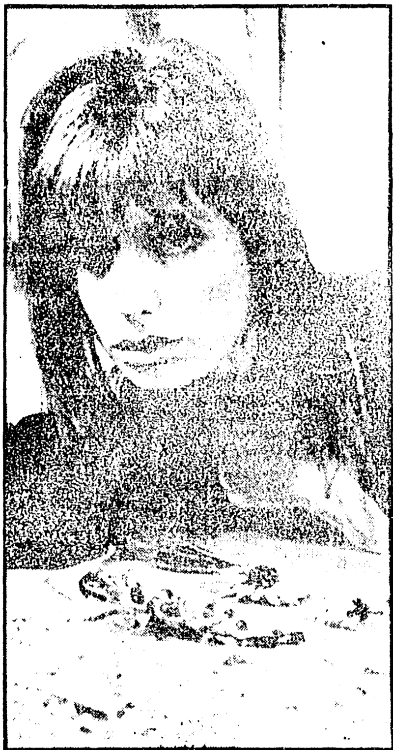
PARIGI — La graziosa Jane Birkin, qui fotografata in adorazione davanti ad alcuni pregiatissimi gioielli di Boucheron, continua a scandalizzare i benpensanti. Interprete, come cantante, di «Je l'aimé...» e di altre canzoni erotiche che hanno dato da fare alle censure di tutto il mondo, anche sullo schermo Jane continua a tener fede al suo ruolo di «musa del vizio».