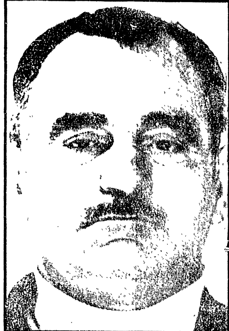
Il boss Gerolamo Moncada

LONDRA, 13. La signora Molly Dimmock, di 37 anni, ha vinto la causa intentata per ottenere un risarcimento danni in seguito ad un incidente stradale in cui perse l'olfatto nel 1967. Benché il giudice lord Albery Russell abbia stabilito in appello che la donna non ha il profumo a beneficio degli uomini, ha riconosciuto che la menomazione subita limita l'attrattiva della signora Dimmock in questo campo. Infatti, come ha detto la signora in tribunale, non solo per effetto della perdita dell'olfatto, non può più godere lei stessa del profumo che indossa (osservazioni non accettabili appieno dal giudice) ma non sa nemmeno regalarla sulla quantità.