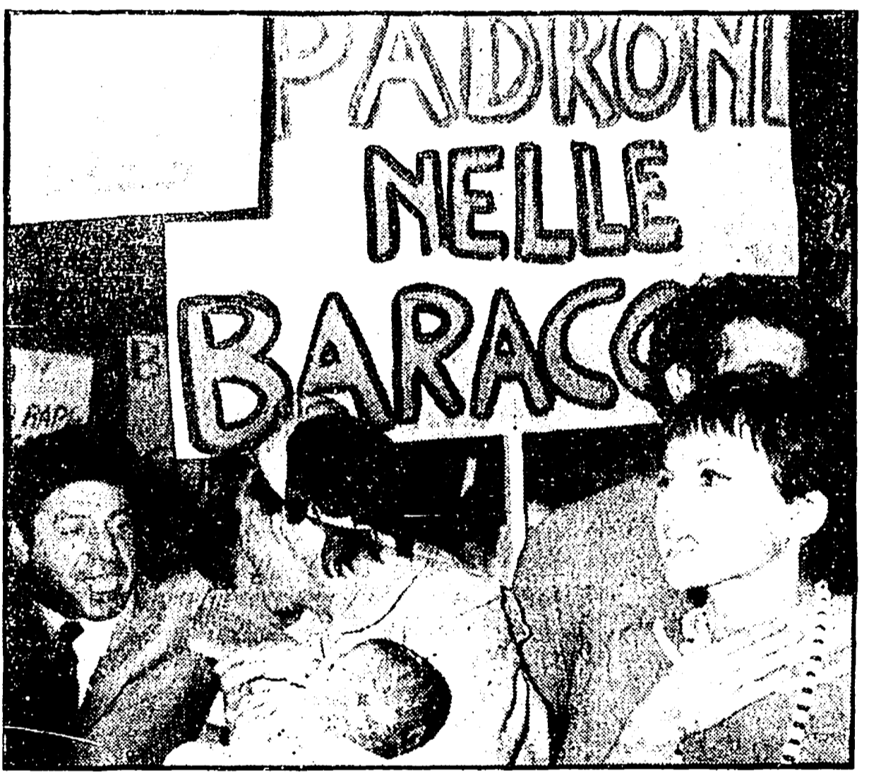
La protesta per la casa è uno degli elementi che caratterizzano il 1969