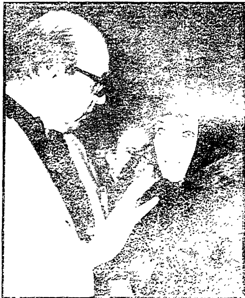
Il regista Edmo Fenoglio, insieme ad un'altra interpretante del romanzo di Mann, Valentina Cortese.

A Torino con la troupe che prepara la riduzione del romanzo di Thomas Mann