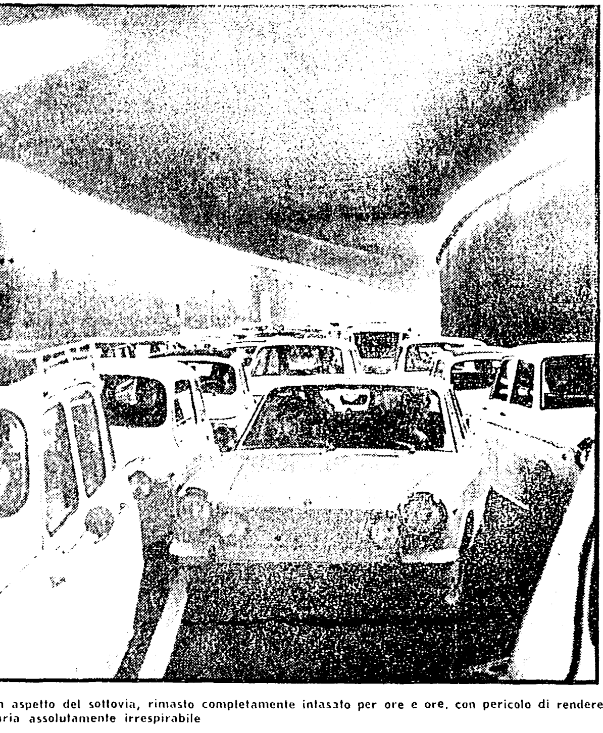
Un aspetto del sottovia, rimasto completamente intasato per ore e ore, con pericolo di rendere l'aria assolutamente irrespirabile

CELLULI: ore 19, conferenza di organizzazione (Bischi); ATAC: ore 19,30, in via Val Rillo 3, C.D. e collegio provinciali.