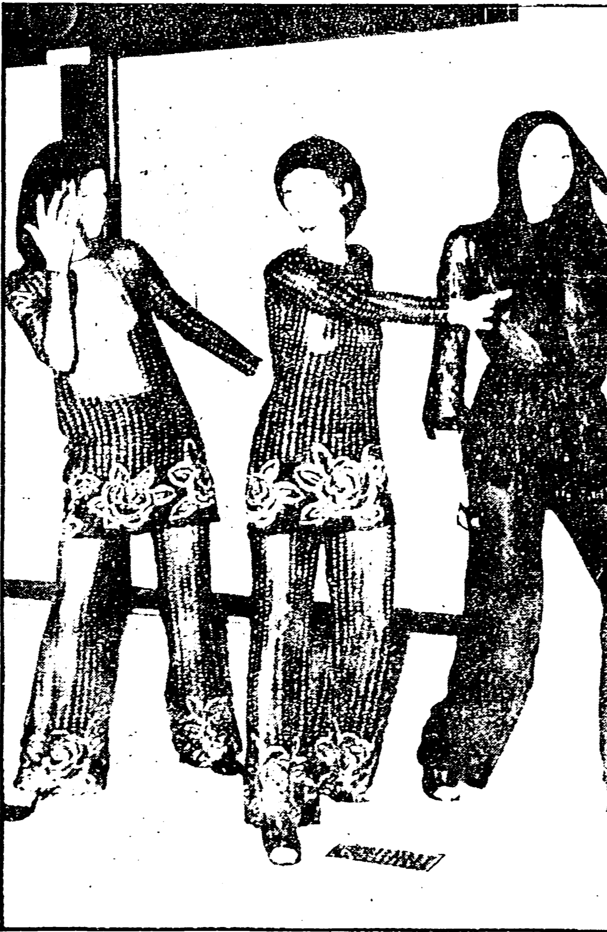
Moda internazionale 1970: così l'hanno lanciata in passerella le case d'alta moda della Germania federale. E' sempre più «nude look», ma ironicamente sottolineato dall'austerità del nero e dalla severa scollatura. Un vago e altrettanto ironico richiamo al passato si può trovare nei sofisticati ricami a perline e strass; un tempo prerogative delle borsette e delle tuniche e anni '20», adesso accompagnano i pigiami trasparenti, non da notte ma da sera. Dal Charleston agli scatenati motivi del giorno d'oggi; la continuità è data dalla moda?