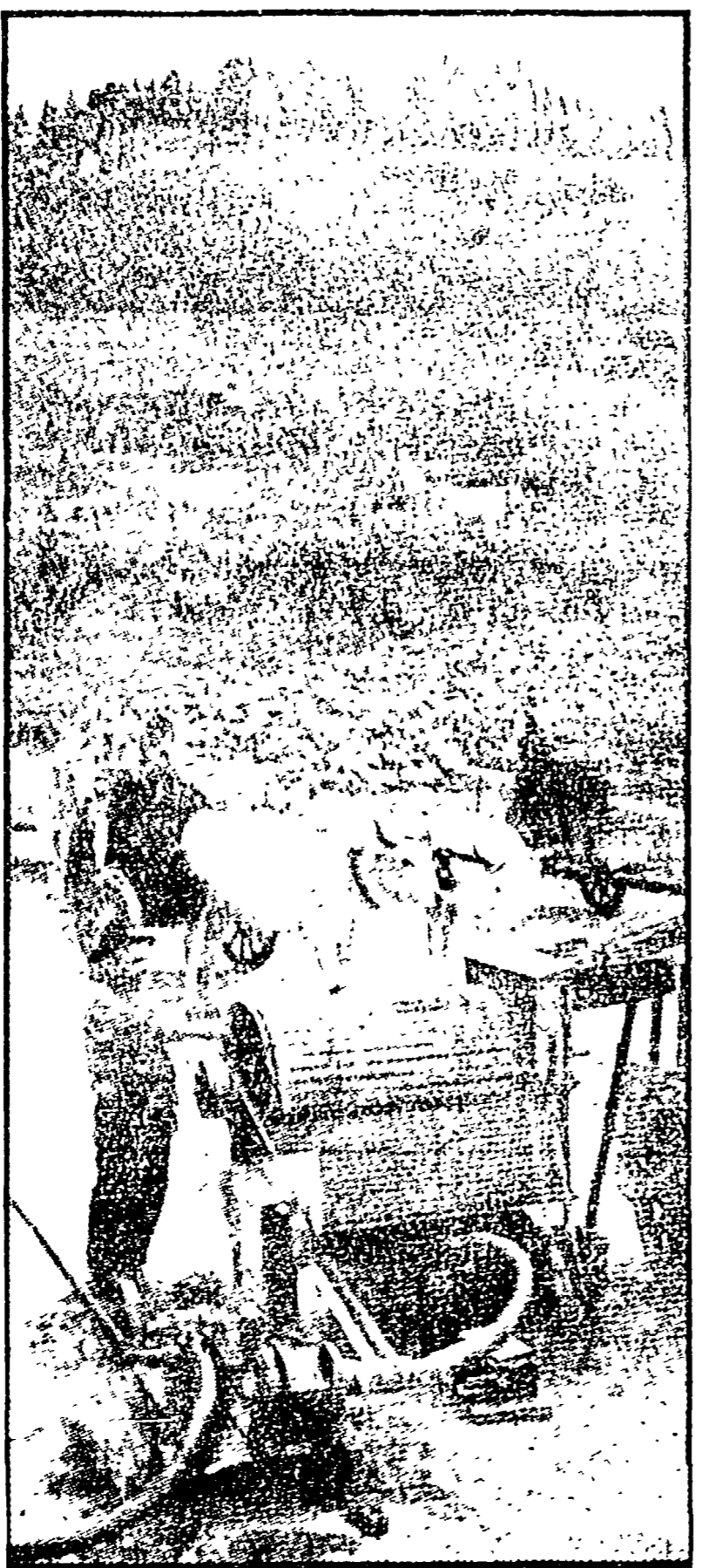
Così era il Chianti; ora è il momento della meccanizzazione