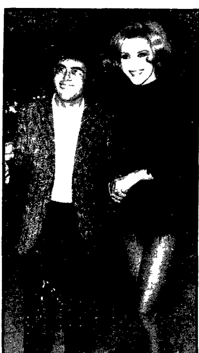
Al Bano e Alice Kessler