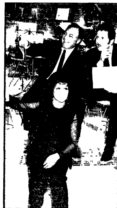
Tre finalisti Claudio Villa, Modugno e Orietta Berti