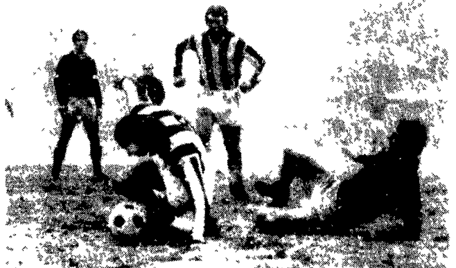
Il campionato di calcio ha percorso ormai la prima metà del suo cammino. Il Cagliari si presenta alla fine del girone d'andata campione d'inverno con tre punti di vantaggio su Inter, Fiorentina e Juventus...

Le indagini per gli attentati di Milano e Roma ad una svolta