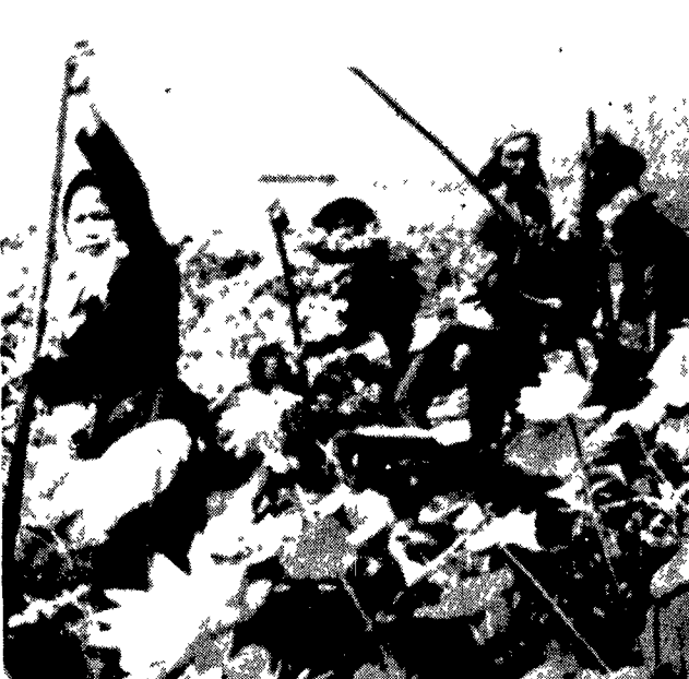
VIETNAM DEL SUD - Una pattuglia di partigiani sud vietnamiti in fase di spostamento in una zona del Mekong attraverso uno specchio d'acqua coperto di piante di foto