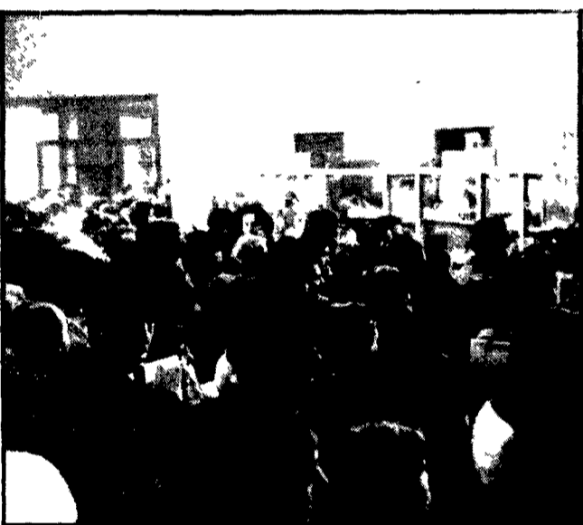
Decine e decine di cittadini in coda in un ufficio postale

Bolli, pensioni, canoni, licenze varie centinaia di migliaia di conti correnti che costrungono in questi giorni i romani a lunghe esasperanti file agli sportelli degli uffici postali. Entriamo in un qualsiasi grande o piccolo che sia centrale o periferico la scena è sempre la stessa. Da una parte un fiume di persone, una folla annoiata preoccupata e impaziente per le lunghe ore che sarà costretta a perdere in quella stanza piena di fumo, i visi tesi e nevrotici che protestano contro l'inefficienza dello Stato e il «disprezzo» per il cittadino. Dall'altra parte — separati da una sottile barriera di vetro — pochi picchissimi impiegati distutti dalla fatica costretti ad orari massacranti sottoposti ad un ritmo infernale da catena di montaggio.