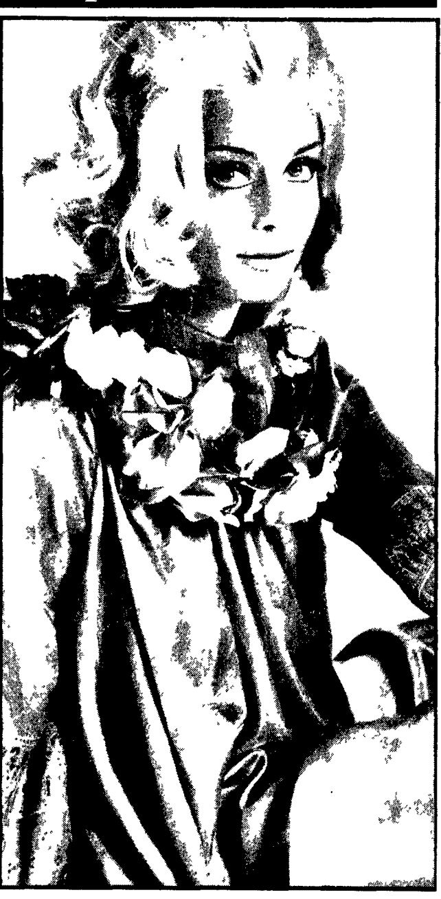
Dopo la sconfitta piuttosto clamorosa di « Canzonissima » (che non l'ha vista nemmeno fra i sei finalisti), Patty Pravo ha deciso di riprovare a San Remo. La notizia della sua partecipazione alla principale rassegna canora nazionale (che quest'anno, oltretutto, celebra vent'anni) ha colto tutti di sorpresa, giacché la reginetta del Paper sembrava decisa a tenersi lontana da ogni competizione. Ma per i cantanti, si sa, decide sempre e soltanto l'industria discografica e San Remo (come « Canzonissima ») è sempre un ottimo trampolino per lanciare un disco e incassare centinaia di milioni.