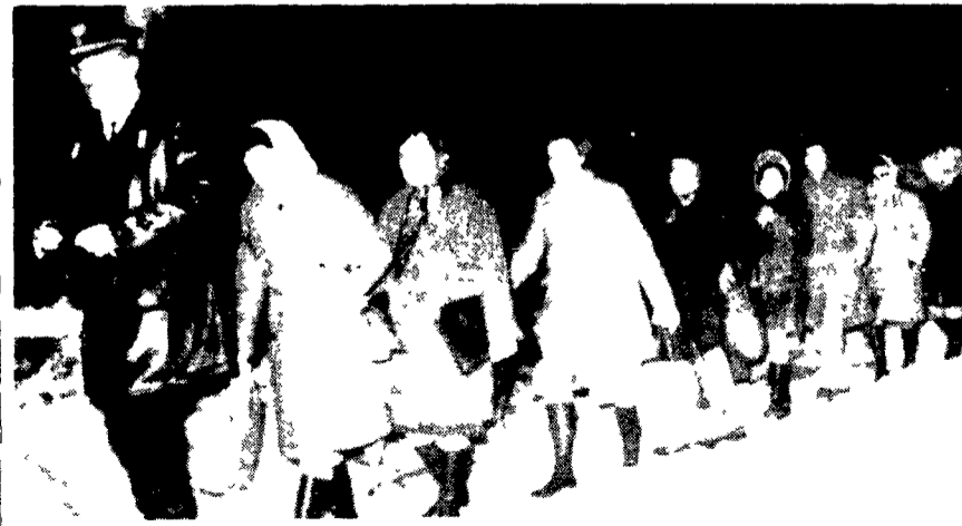
GENOVA. Un elettrotreno con 150 passeggeri a bordo è rimasto bloccato dalla neve per dodici ore a vici alla stazione di Mele sulla linea Genova Ovada. NELLA TELEFOTO ANSA il momento in cui i file dei passeggeri raggiunti dall'autocolonna di soccorsi viene guidata in camionette.