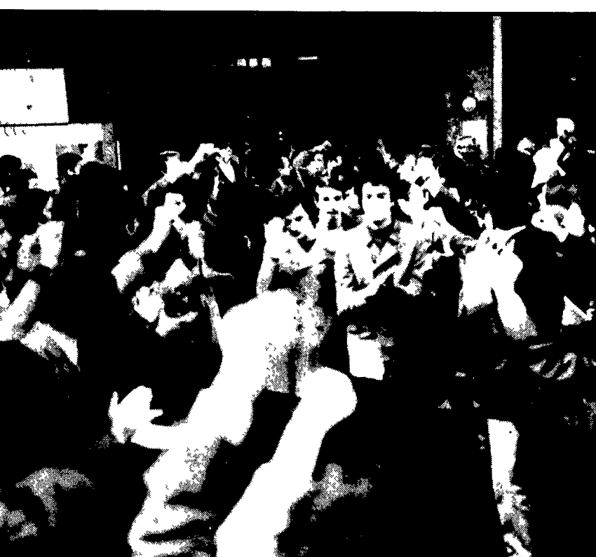
I giovani del liceo «Sarpi» mentre escono dall'istituto salutati dai compagni a pugno levato