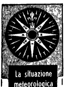
La situazione meteorologica