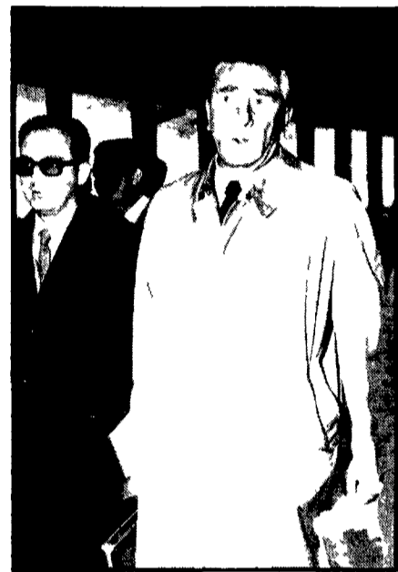
VALCAREGGI al suo arrivo a Fiumicino