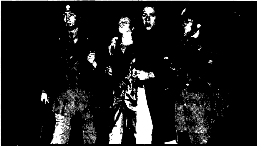
Una ragazza ferita durante le cariche della polizia a Milano

La versione della polizia smentita perfino dal «Corriere» - Lo sdegno della città - Un comunicato delle tre organizzazioni sindacali - Convocate assemblee operaie in tutte le fabbriche - Anche «Il Giorno» scrive che era possibile evitare la carica - Vibrata protesta dei giornalisti, interrogazioni di parlamentari di PCI, PSI e PSIUP - Il dottor Guida: da carceriere degli antifascisti a Ventotene a questore della repressione