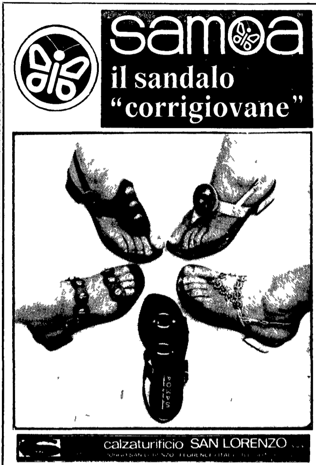
calzaturificio SAN LORENZO