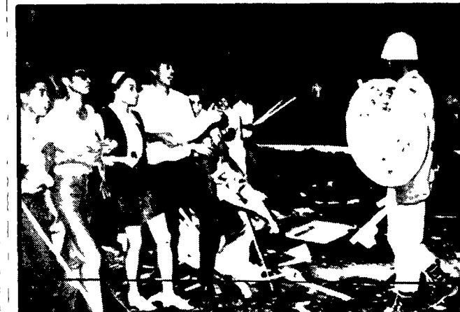
MANIFESTAZIONI A MANILA. Il presidente filippino, Marcos, è stato fatto segno a grida di «fantoccio» e al lancio di bottiglie...