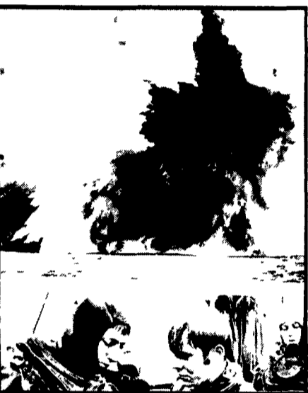
LO SCOPPIO DELLA VECCHIA BOMBA A Plymouth, dinanzi alla costa inglese. Meccanizzatori della marina militare hanno fatto scoppiare una vecchia bomba tedesca da 1000 chili rinvenuta sul fondale, segnalata sull'Inghilterra durante la seconda guerra mondiale.