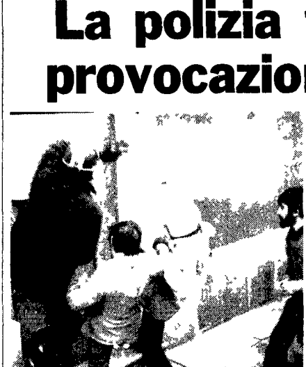
MILANO - Alcuni fascisti tentano di abbattere a calci una porta dell'Università