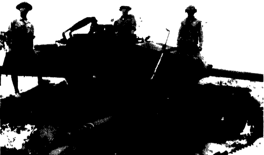
VIETNAM DEL SUD - Combattenti dell'esercito di liberazione del Vietnam del Sud sulla carcassa di un carro armato distrutto in uno scontro nella provincia di Quang Tri

Anche Van Thieu ha fatto una dichiarazione analogica - Condannato a cinque anni di lavori forzati un giovane autore di canzoni contro la guerra - 34 cacciabombardieri americani a Ciang Kai-cek