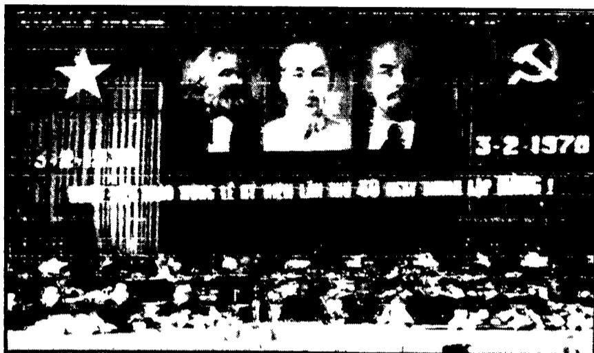
HANOI - Un aspetto della cerimonia con cui è stato celebrato il 40° anniversario della fondazione del Partito dei lavoratori del Viet Nam

Nel 1972 resteranno a Saigon ancora 250.000 soldati USA - Hanoi denuncia nuove incursioni dell'U.S.A. Air Force e attacchi ai centri abitati - Gli USA tentano di «pacificare» anche la Piana delle Giare, nel Laos - 15 basi attaccate dai partigiani