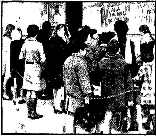
Bambini e madri con cartelli di protesta dinanzi alla scuola «Carrolli»