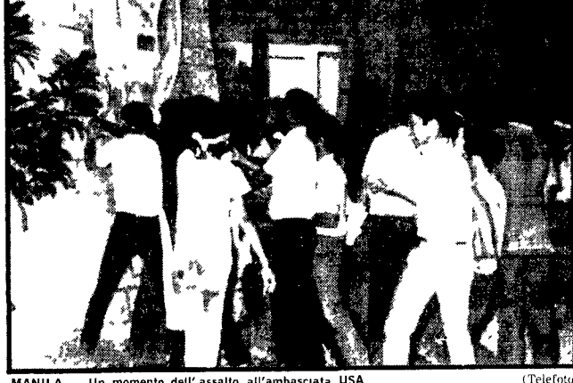
MANILA - Un momento dell'assalto all'ambasciata USA