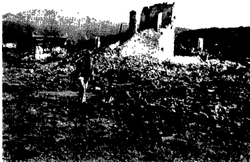
La foto che qui pubblichiamo ci dà un'immagine drammatica delle condizioni in cui gli aerei americani, in maggioranza B-52, hanno ridotto la Piana delle Giare nel Laos. La telefoto, diffusa ieri dall'AP, mostra uno dei pochi civili sottrattisi alla deportazione, mentre si aggira tra le macerie di Xien Khouang.